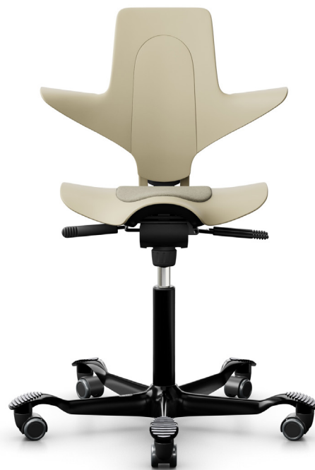
Design: Peter Opsvik. Modèle déposé et breveté