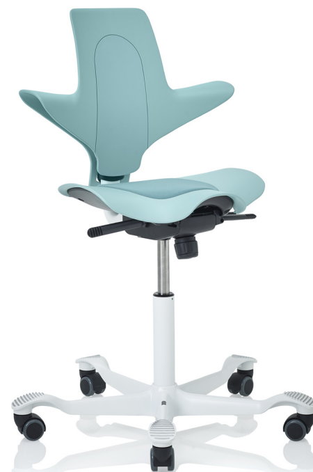
Design: Peter Opsvik. Patent- och designskyddad.