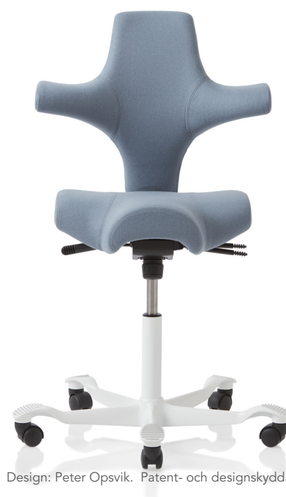
Design: Peter Opsvik. Patent- och designskyddad.