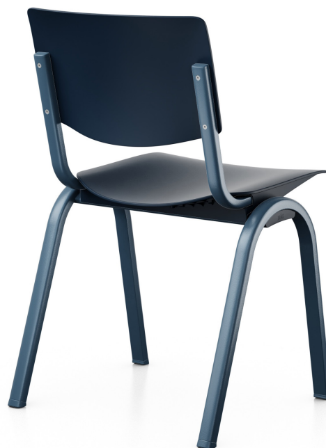
Design: BIG-GAME, Hunting & Narud, Anderssen & Voll et équipe design de Flokk