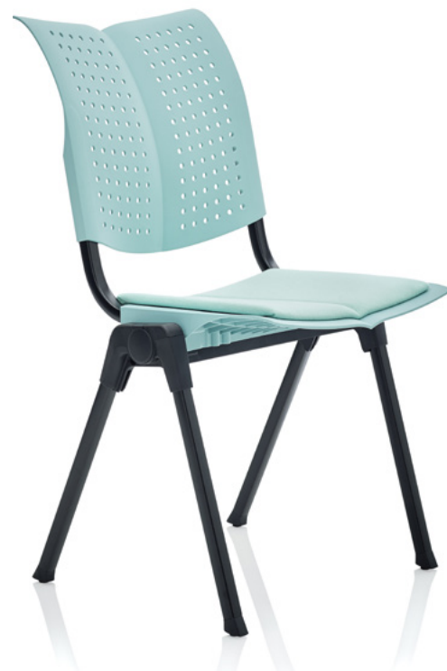
Design: Peter Opsvik. Patent- og designbeskyttet