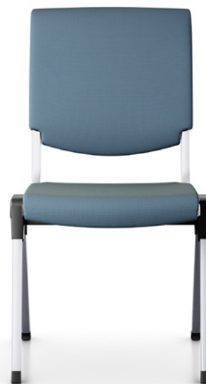
Design: Peter Opsvik Patent- und Designgeschützt.