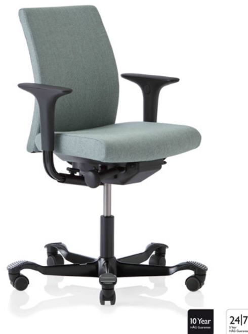
Design: Peter Opsvik. Patent- og designbeskyttet.