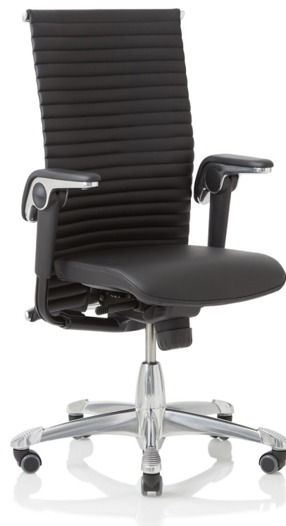
Design: Svein Asbjørnsen/sapDesign@. Patent- and design protected.