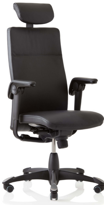
Design: Svein Asbjørnsen/sapDesign®. Patent- and design protected.