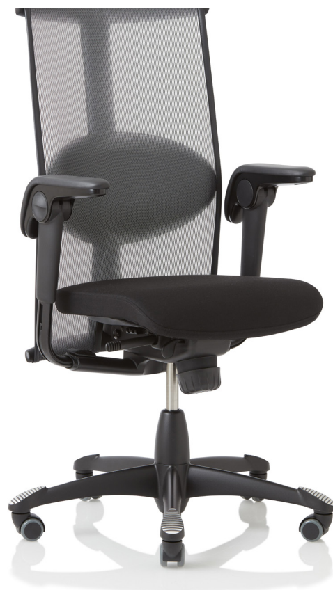
Design: Svein Asbjørnsen/sapDesign®. Patent- och designkyddad.