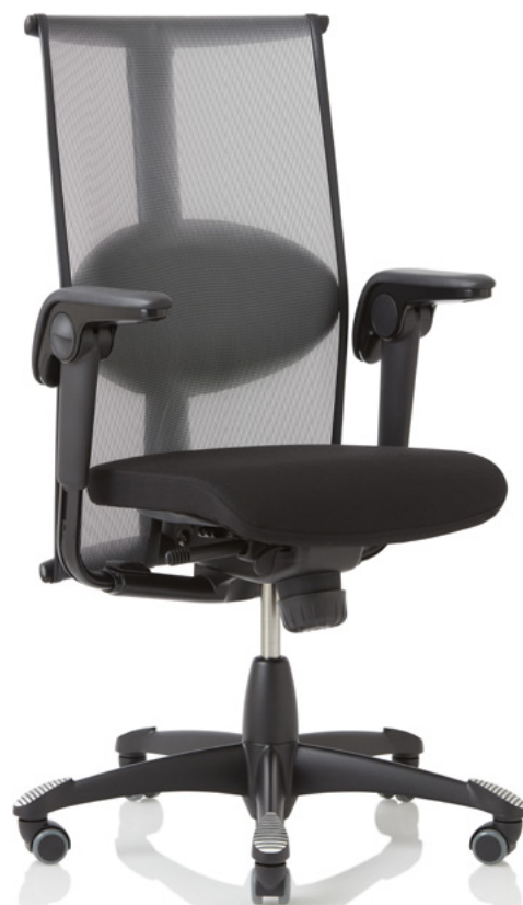
Design: Svein Asbjørnsen/sapDesign®. Patent- und Designgeschützt.