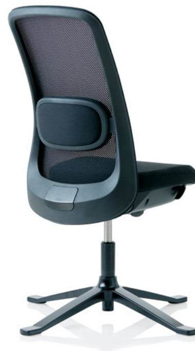
Design: Frost Produkt AS, Powerdesign og Flokk Design Team Patent- og designbeskyttet