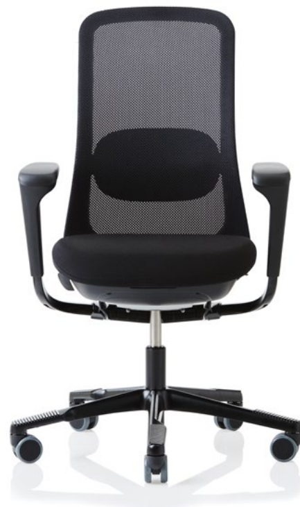
Design: Frost Produkt AS, Powerdesign AS og Flokk Design Team Patent- og designbeskyttet