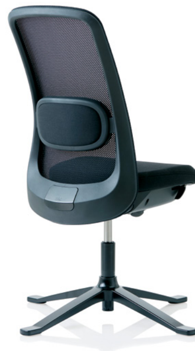
Design: Frost Produkt AS, Powerdesign og Flokk Design Team Patent- og designbeskyttet