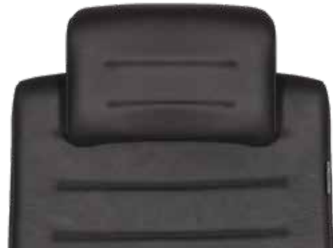
KOPFSTÜTZE MIT STOFF ODER LEDER BEZOGEN