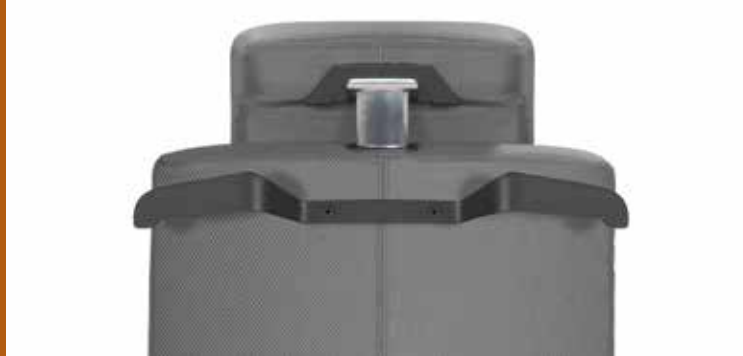
KLEIDERBÜGEL IN SCHWARZ LACKIERTEM ALUMINIUM