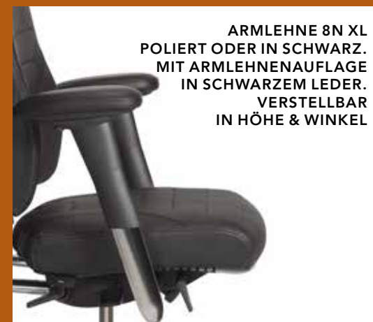
ARMLEHNE 8N XL POLIERT ODER IN SCHWARZ. MIT ARMLEHNENAUFLAGE IN SCHWARZEM LEDER. VERSTELLBAR IN HÖHE & WINKEL