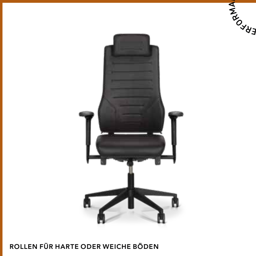
ROLLEN FÜR HARTE ODER WEICHE BÖDEN