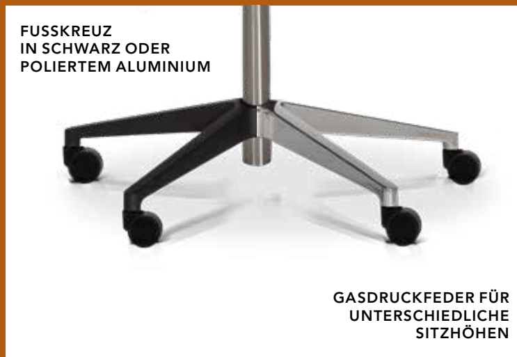
GASDRUCKFEDER FÜR UNTERSCHIEDLICHE SITZHÖHEN

Für den RH Axia Exclusive ist eine Vielzahl von Optionen und Zubehör erhältlich. Weitere Informationen finden Sie in unserer Preisliste.