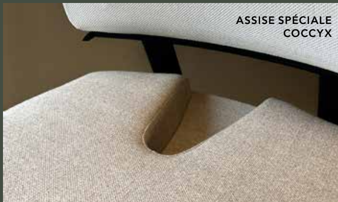
ASSISE SPÉCIALE COCCYX

MÉCANISME A A = noir ou poli - réglage de la hauteur d'assise et de l'inclinaison de l'assise et du dossier