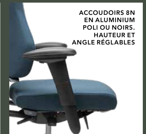
ACCOUDOIRS 8N EN ALUMINIUM POLI OU NOIRS. HAUTEUR ET ANGLE RÉGLABLES