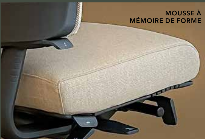
MOUSSE À MÉMOIRE DE FORME