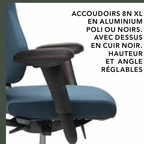
ACCOUDOIRS 8N XL EN ALUMINIUM POLI OU NOIRS. AVEC DESSUS EN CUIR NOIR. HAUTEUR ET ANGLE RÉGLABLES