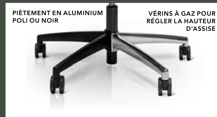
PIÈTEMENT EN ALUMINIUM POLI OU NOIR