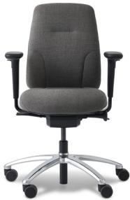
RH LOGIC 200