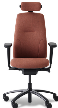
RH LOGIC 220