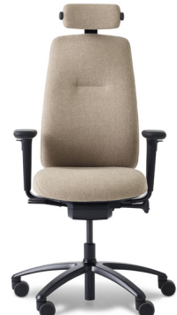
RH LOGIC 220 ELITE