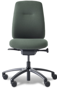
RH LOGIC 200 ELITE

200 mm extra vulling in zit- en rugkussen