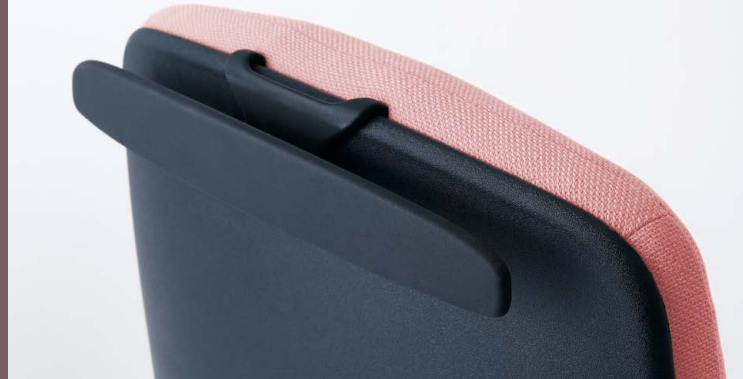
KLEIDERBÜGEL IN SCHWARZ