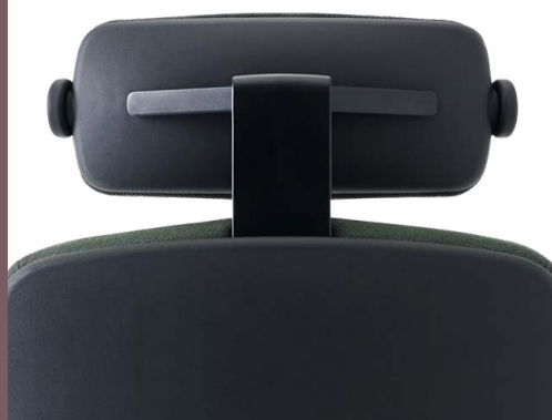
NACKENSTÜTZE IN SCHWARZEM ALUMINIUM/KUNSTSTOFF