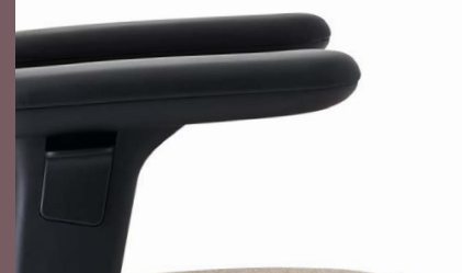
ARMLEHNEN IN SCHWARZEM ALUMINIUM MIT AUFLAGE IN TPU ODER LEDER