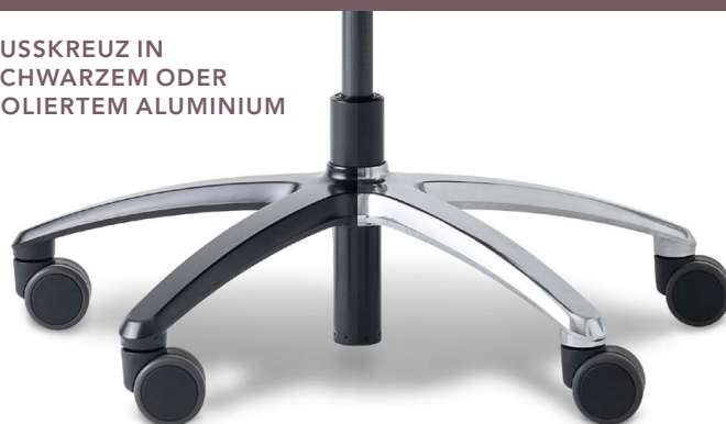
GASFEDER ZUR ANPASSUNG DER SITZHÖHE