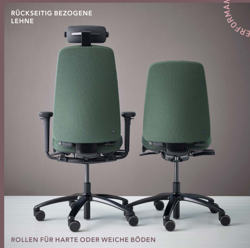
ROLLEN FÜR HARTE ODER WEICHE BÖDEN