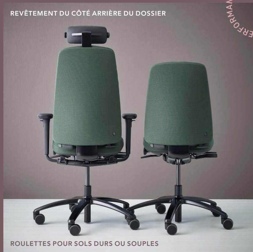
ROULETTES POUR SOLS DURS OU SOUPLES