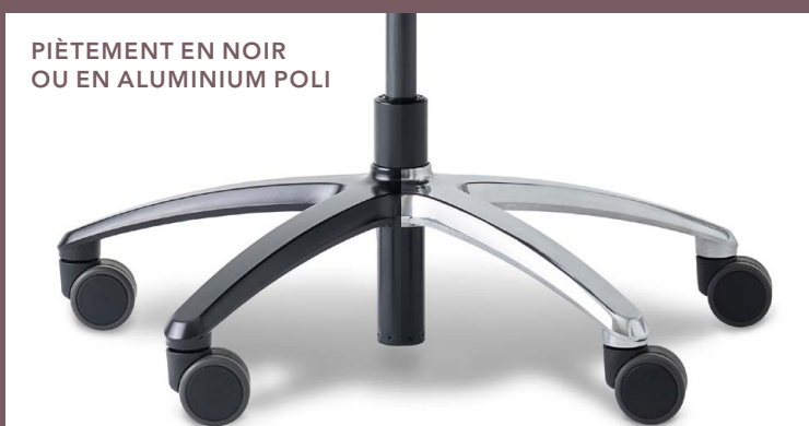
RESSORT À GAZ POUR DIFFÉRENTES HAUTEURS D'ASSISE